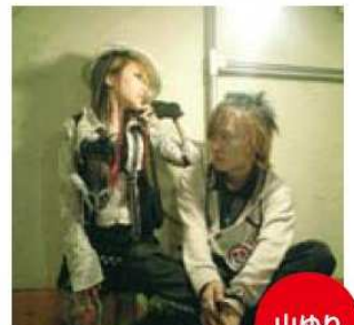
第1回りぶらミュージック フェスティバル優勝者